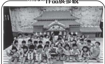
みんなの作品展参観 誠にありがとうございました 誠櫻幼愛園