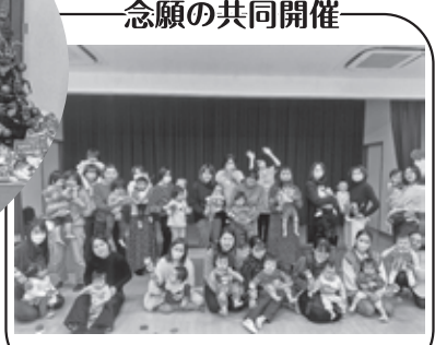
念願の共同開催 駅前子育てひろば