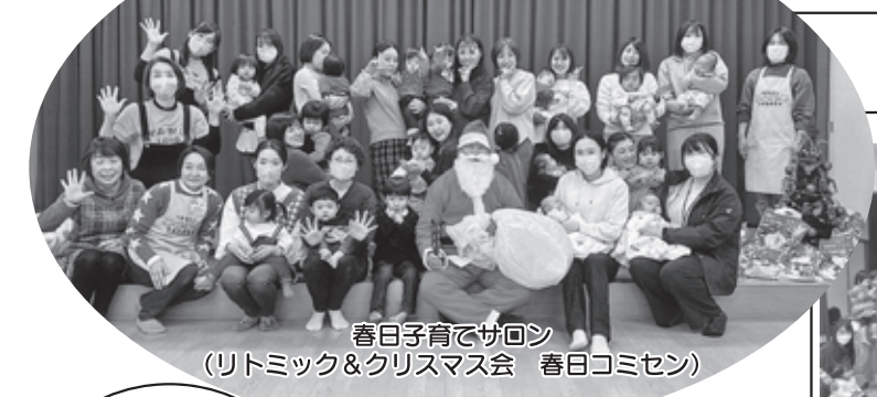
楽しかったサロン 春日子育てサロン (リトミック&クリスマス会 春日コミセン)