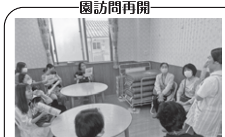
園訪問再開 KASUGAよんちようめ保育園