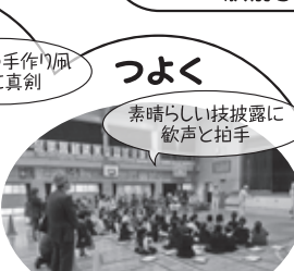
つよく 素晴らしい技披露に 歓声と拍手 ちゃんかけごま