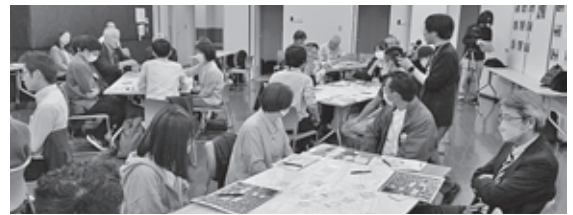
熊本駅新幹線口駅前広場改修に関するワークショップ(熊本市 市街地整備課)熱心に議論に参加した校区の皆さん

駅周辺に関する様々な課題について、「ワークシヨップ」を数回開催しています。現在新幹線口のロータリー見直しや熊本駅周辺の車輛混雑解消等について問題提起し議論を重ねています。各町内については3割近くが高齢化する住民に対する福祉サービスの低下が懸念されています。行政で対応しきれないサービスを地域に委ねる案件が数多くあり、福祉活動は最も重要な課題です。助けを必要とする高齢者(一人暮らし、要支援者等)、妊産婦、生活困窮者等の必要なサービスが提供出来ない状況になっています。人員不足、担い手不足の状況を何とか克服する名案はないのか、自治会や各団体ではこの問題に真剣に取り組んでおり、多くの校区で同様な課題を擁しているのが現状です。2024年の予想は出来ませんが、ひとり一人が地域の担い手として「目配り、気配りなど」すれば、個々の住民による不安解消の助けとなり自らも安心、安全を享受出来ると思えます。本年が皆様にとって、「龍辰」のごとく天に駆け上る、より良い年となりますように心から祈念申し上げます。