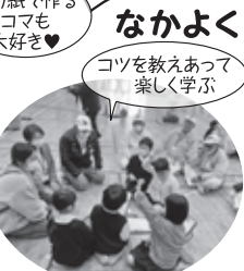
なかよく こままわし