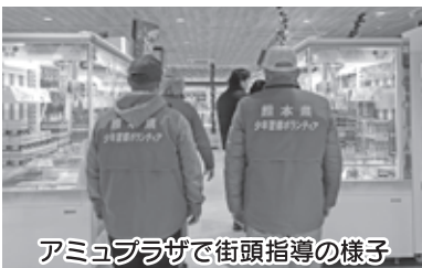
アミュプラザで街頭指導の様子

穏やかな年の初めをお迎えのことと思います。校区の皆様には、日頃から子どもたちを見守りいただきありがとうございます。昨年は春日小学校創立150周年という節目の年を迎えました。子どもたちには次のステップへ向け、春日の歴史や伝統、文化を引き継いでいただきたいと思います。 さて、昨年、青少協ではぼうぼうまつりや地域交流会への参加、花陵校区の見回りなど校区内外での活動をはじめ校区の危険箇所について南署及び西区土木センターへ改善の要望を行いました。校区内で危ないと思われる箇所や注意を要する場所については、毎年、PTA、交通安全協会、消防団、「こども110番の家」、「歩くこども110番」の皆さんと連携しながら調査を行っており、南署へは横断歩道の設置や白線の塗り替え、パトロールの強化、また土木センターへはカーブミラーや防犯カメラの設置などを要望しました。安全・安心で快適なまちづくりができればと思います。 春日校区は駅前や駅周辺の整備によりその町並みが大きく変わってきています。本年も校区の皆様には防犯の目となって子どもたちを見守りいただきませうようお願いいたします。