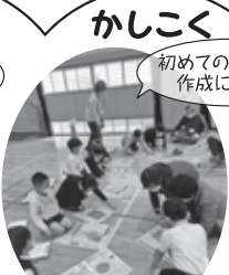
かしこく 初めての手作り風 作成に真剣 凧づくり