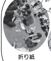
やさしく 折り紙 他:竹とんぼ 竹馬 紙ひこうき お手玉