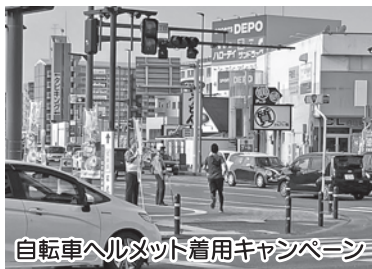
自転車ヘルメット着用キャンペーン

7月1日には改正道交法の施行に伴い、電動キックボードに関する新たな交通ルールが適用されました。とても魅力的な乗り物ですが、年齢・免許・車体のサイズ・速度・ヘルメットの要不要などの規定が細かく分けられていますので、購入を検討されている方は警察やメーカーのホームページなどで確認してください。