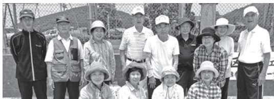
西区区民グランドゴルフ大会(6月7日)

春日体協も年間の活動を明らかにするとともに、地域住民とのふれあい、健康増進をまちづくりの一環とした様々なイベントを今年度は計画しました。ただ春日小学校運動場が半年間利用できないのが残念です。出来ることを、出来るだけ、無理せず明るく楽しく、をモットーに取組みます。