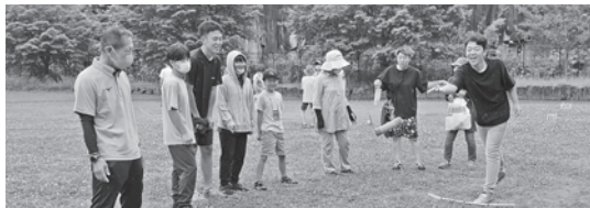
区民フェスモルック体験競技会に参加(6月11日)