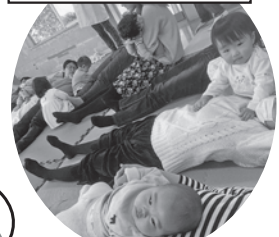
ベビー&マミーピクス