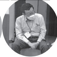
地域ボランティアの皆さん