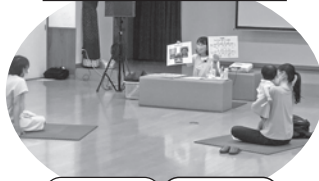
防災の話 歯科相談 離乳食の話