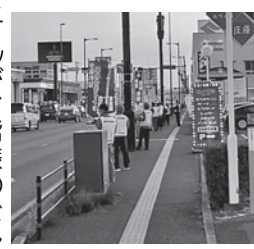
令和4年の「ひのくにピカピカ運動」の様子

1月31日まで「ひのくにピカピカ運動」を実施中です。例年、秋から冬にかけて日没が早まり、夕暮れ時から夜間にかけての交通事故が多発する傾向にあります。歩行者や自転車は「反射材」を活用して自分の身は自分で守りましょう。ドライパーは午後5時を目安に前照灯を点灯し、対向車がないときは「上向き点灯」を心がけ、交通事故の抑止に努めましょう。