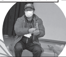
親子バルーンアート遊び