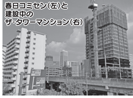
春日コミセン(左)と建設中のザ・タワーマンション(右)

春日校区では長年に亘った熊本駅周辺整備事業を終え、熊本陸の玄関口としての機能が整いました。駅周辺は金融機関を始め、ホテルや商業施設、映画館等のアミューズメント機能を併せ持った近代的な地域へと変貌しました。目まぐるしく展開していく地域に目を奪われるばかりです。現在も幾多のマンション建設が続いており、住環境の変化で戸惑いながらも、2022年が干支「壬寅」(陽氣を孕み、春の胎動を助く意)のように、「夢」と「希望」を見出せる素晴らしい年となることを心から祈念いたします。本年も宜しくお願いたします。